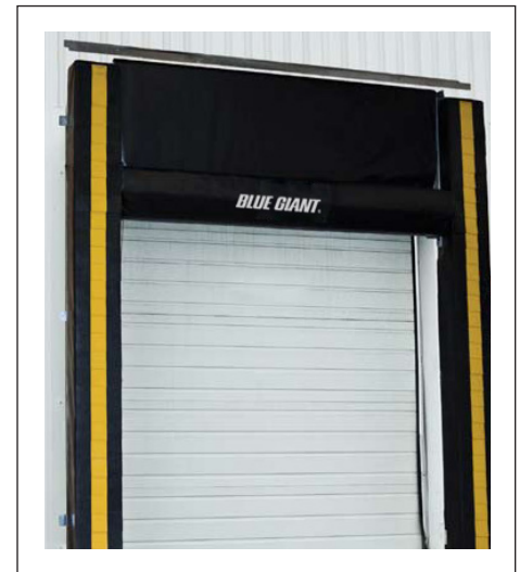
Sello de Muelle o Andén con almohadilla de cabezal ajustable – Modelo BGDSA